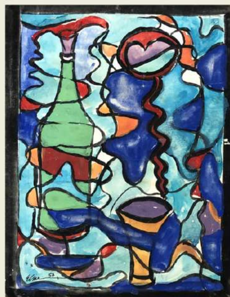
Série vitrais , 1957, Elke Hering Aquarela sobre papel, 17,4 x 13,9 cm Coleção Collaço Paulo